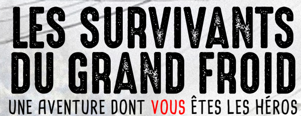
ILLUSTRATION : FILIP DUBECK

Vos réserves durement amassées commencent à diminuer dangereusement. Pour assurer votre survie, vous allez devoir sortir et tenter votre chance à l'extérieur, braver le Grand Froid et ses dangers.